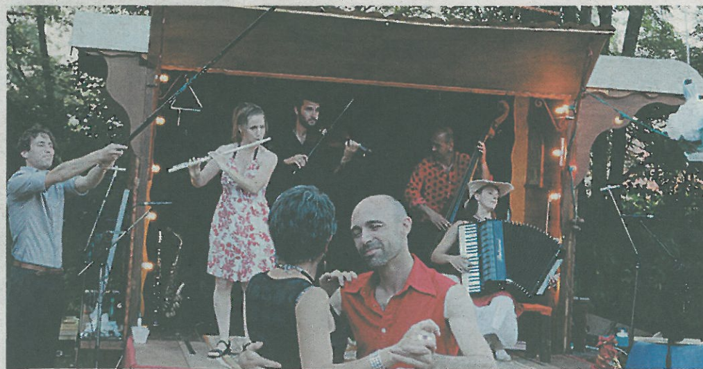
Un momento dello spettacolo della Carovana Balacaval