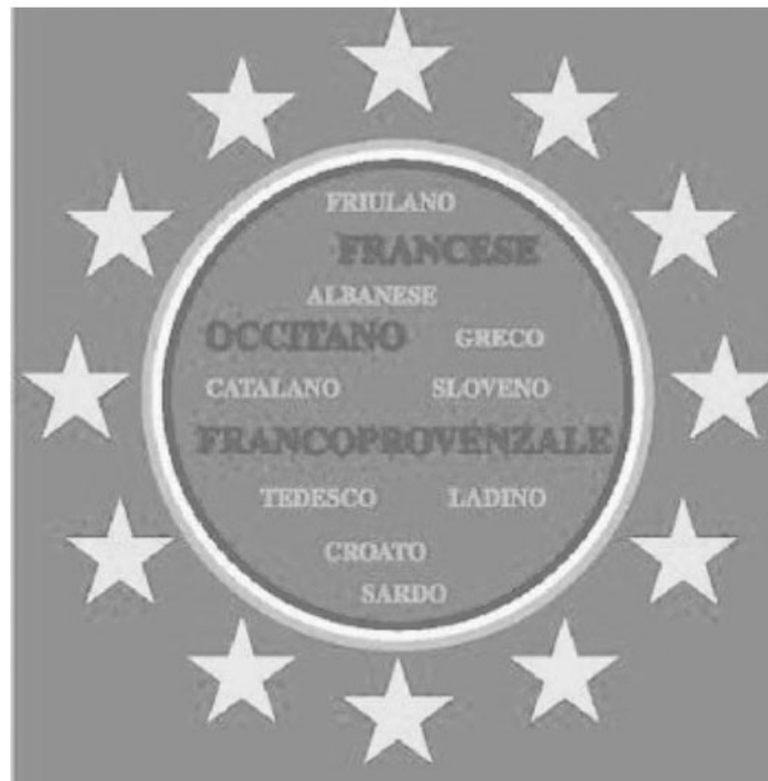
Lo stemma del centro studi di Giaglione

Un centro studi per documentare la memoria orale